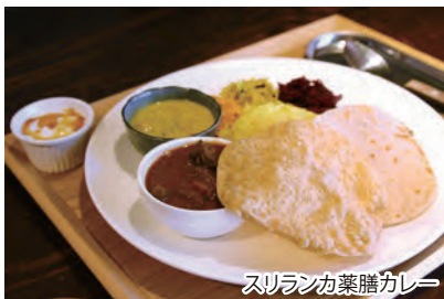
スリランカ薬膳カレー

住んでいましたが、震災以来、家族のことや健康のことを深く考えるようになり移住。自分が生まれ育ったスリランカでは生活の中に普通にあった自己治癒や医食同源の考え方を日本の人たちにも提供したいと考え、スリランカで本格的にアーユルヴェーダを学び、今は奥様と共に施術に調理に、そしてアーユルヴェーダの普及にと、日々奮闘しています。 文:サカタヒロユキ